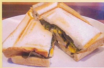
ホットサンドめんたいのり 横田会場のみ cafeシナトラ 500円