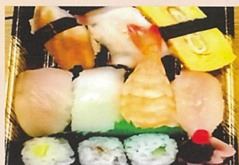
にぎり寿司セット 賀松園横田店 1000円