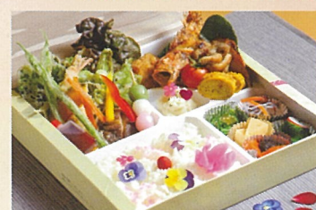
春の彩り弁当 味処 玉峰 1000円