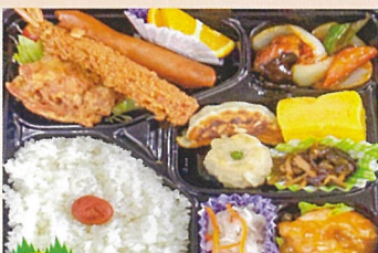
中華弁当 直久 1000円