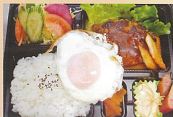
ジビエハンバーグ弁当 まいもんや味奈里 1000円