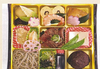
旬彩弁当 扇屋そば 1000円