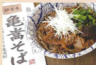
扇屋そば&奥出雲屋タッグ 「奥出雲肉そば」 奥出雲屋 700円