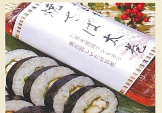
焼きサバ太巻き 美好乃 700円