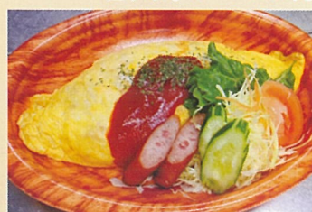
オムライス弁当 まいもんや味奈里 700円