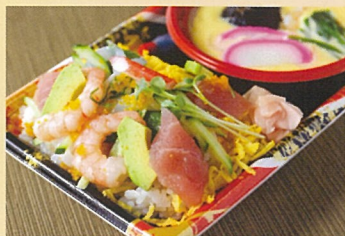
海鮮ちらし寿司と茶碗蒸し 奥出雲屋 500円

*写真と当日のメニューの内容が異なる場合があります。 *表示価格は税込価格です。