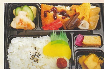
田舎弁当 大衆 500円