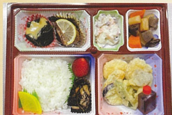
花見弁当 田中屋旅館 700円