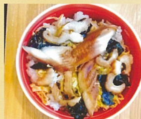
あなごちらし 賀松園横田店 700円