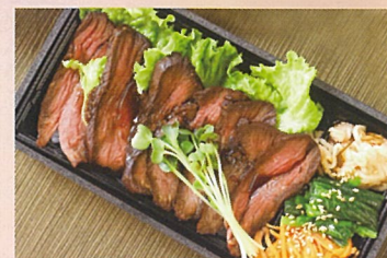
しまね和牛ローストビーフ重 奥出雲屋 1000円