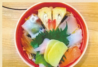
海鮮ちらし 賀松園横田店 1000円