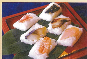
笹ずし 今回だけの特別価格 飯田屋 1000円