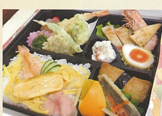
春色弁当 喜久寿し 1000円