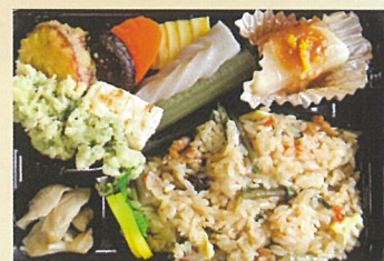
山菜おこわ弁当 食彩の里 玉峰 700円