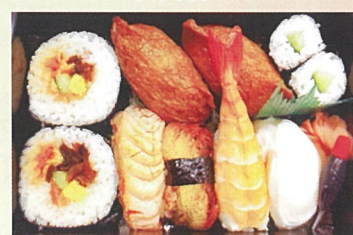
寿司べんとう 賀松園三成店 1000円