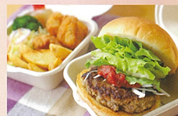
しまね和牛バーガーランチボックス 横田会場のみ 11:00~ ピコピコ 1000円