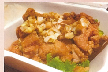
油淋鶏弁当 きっちん焚菜 700円