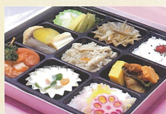
春の松花堂弁当 川芳 1000円