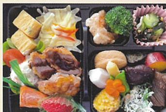
アタリマエノ ヨノナカニ・・・ 浪花旅館 1000円