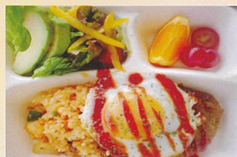
ロコモコ弁当 仁多会場のみ cafeシナトラ 1000円