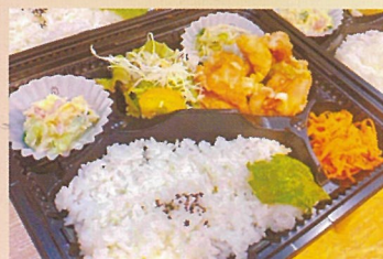
油淋鶏弁当 ともに食堂 700円