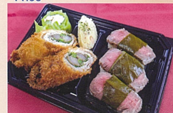
しまね和牛ローストビーフ弁当 焼肉たたら 1000円